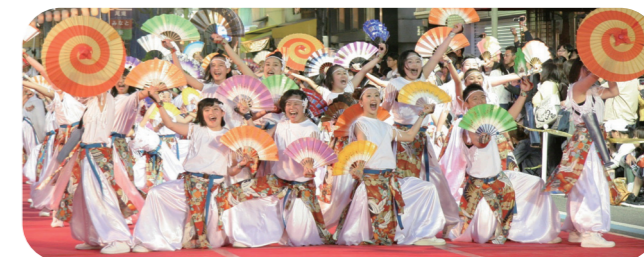
▲昨年の「第16回ええじゃんSANSA・がり」グランプリ部門優勝の平和の舞姿連来夢団