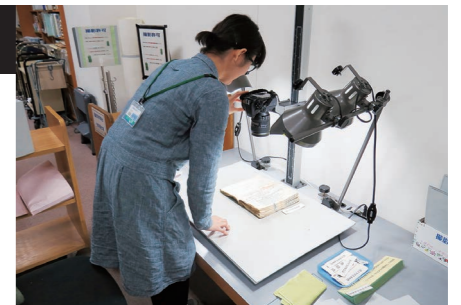
◀国文学研究資料館(東京都)へ資料調査に

これまでに尾道市内で刊行された市史・町史には『因島市史』(1968)全1巻、『新修尾道市史』(1971～1977)全6巻、『御調町史』(1988)全1巻、『瀬戸田町史』(1997～2004)全5巻、『向島町史』(2000)全1巻があります。