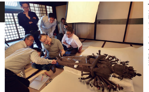
◀光明寺での仏像調査

旧市街地をはじめとする様々な寺社では、仏像などの彫刻の調査が進められています。その中で、これまで未指定だった彫刻の再調査が行われ、新たに文化財的な価値を有することがわかるなど、市史編さん事業が新たな文化財の掘り起こしと再検証の機会となっています。