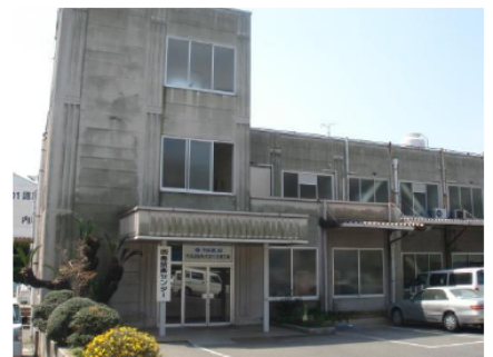
因島技術センター事務所（2F）

因島のICは本州方面からは因島北IC 四国方面からは因島南ICとなります。 車でお越しの場合は御注意ください。