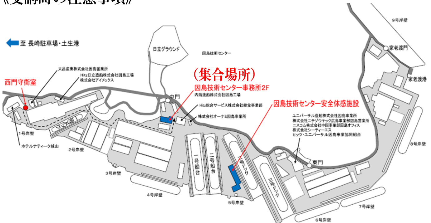
Hitz日立造船株式会社因島工場内図