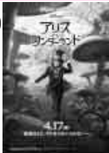
© Disney Enterprises, Inc. All rights reserved.

日にち 5月22日(土) 場所 しまなみ交流館ホール 対象 どなたでも 定員 690人 上映時間 第1回 10:00~11:50 第2回 13:00~14:50 第3回 15:30~17:20