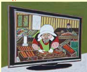
「串柿の里御調放映」 片山 重夫 アクリル画(岡山県)