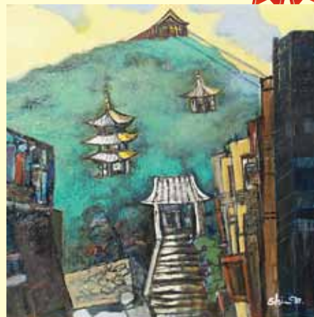
「千光寺の山」 女賀 信太郎 油彩画(福岡県)