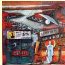
尾道観光協会奨励賞 「ONOMICHI」 下島 悦嗣 油彩画(山口県)