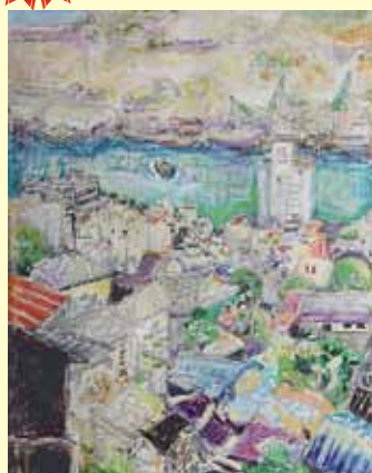
「尾道」森岡 勇二 その他(三原市)