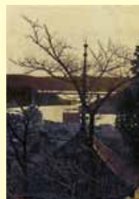
中国電力奨励賞 「声明」 渡壁 公義 油彩画(福山市)