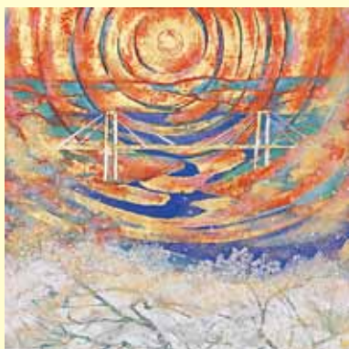
「尾道礼讃(桜花)」 熊谷 融 日本画(宮城県)