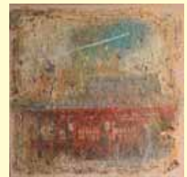
尾道市文化協会奨励賞 「ジェットストリーム」 赤羽 カオル その他(栃木県)