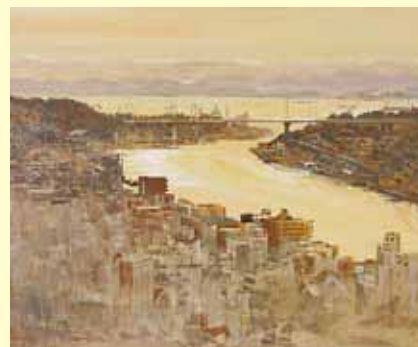
「金色の光降る街」 菅野 善允 油彩画(埼玉県)