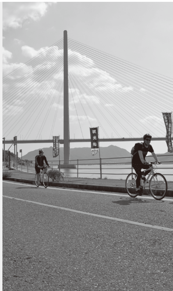
島の景色を楽しみながら走りました。