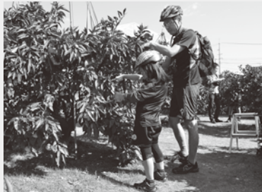
みかん狩りを体験できるコースも人気でした。