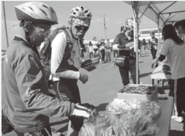
休憩所では尾道特産“銀鱈”いりこでおもてなし。

10月27日、「第2回瀬戸内しまなみ海道サイクリング尾道大会～銀輪パラダイス～」が開催されました。全国から約1,100人が参加していただき、しまなみ海道の景色を堪能することはもちろん、ボランティアスタッフの“おもてなし”にも喜んでいただきました。