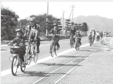
天気も良く、海からの潮風が気持ち良かったです。