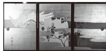
平田玉穂「桐鳳凰図(部分)」天保6年(1835)紙本着色・襖 慈観寺蔵

期間 開催中、1月9日(火)まで ※木曜と12月29日～1月1日は休館 場所 尾道商業会議所記念館(入館無料) ☎ 尾道商業会議所記念館(☎0848-20-0400)