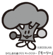
高見山の森づくりキャラクター「モーリー」

高見山の松枯れ、 荒廃した森林の現状 を知り、森づくりの 大切さを学ぶため に、一緒に向島のシ ンボル高見山の森林整備等の学習・ 体験をしてみませんか。