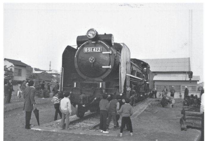
古浜町に設置された D51 422