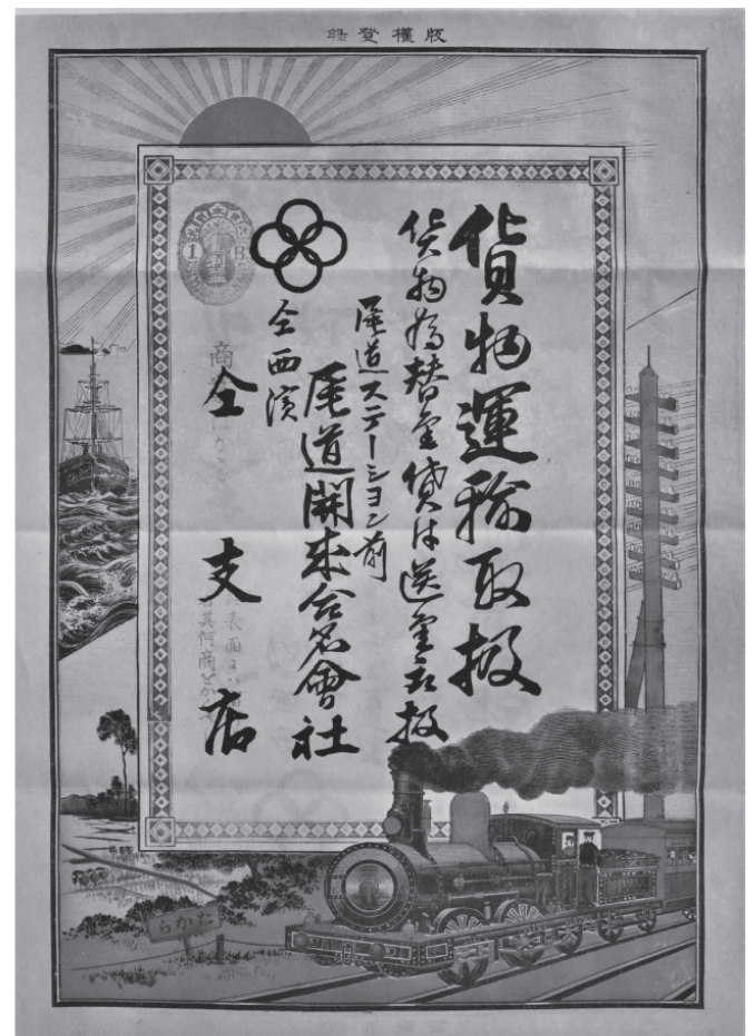
尾道駅前に所在した貨物運送業者の引き札 明治期