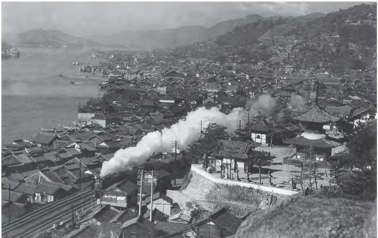
浄土寺下を走るSL 1957(昭和32)年

東から浄土寺山(瑠璃山)、西国寺山(愛宕山)、千光寺山(大宝山)の尾道三山の山裾を走り抜ける鉄道のある風景が、尾道市民にとっても旅人にとっても、尾道らしい一風景として今に認識されています。