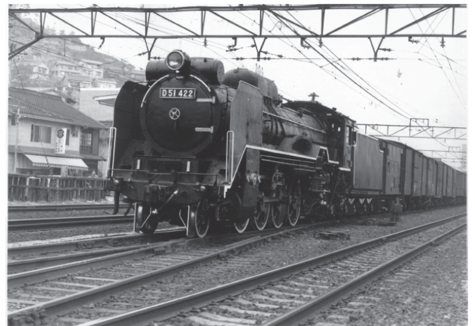
尾道駅に到着した D51 422

設置された年の秋、野ざらし・雨ざらしの環境下にあって車輛の維持管理に窮していた尾道市当局に対し、糸崎機関区に勤務していた尾道在住の職員が清掃保全を買って出た事に始まり、以来、10 月 14 日の鉄道記念日を前に、糸崎機関区に勤務する機関士、次いで同 OB による清掃奉仕が毎年の風物詩として続いてきました。