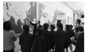
アートスクールバスによる地域交流