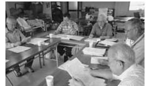
三成学区の歴史資料の整備発信事業

☎0848-722-8501 尾道市久保一丁目15-1 政策企画課協働推進係 ☎0848-25-7435 ✉kikaku@city.onomichi.hiroshima.jp