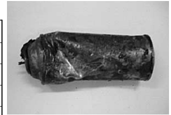
火災の原因となったスプレー缶