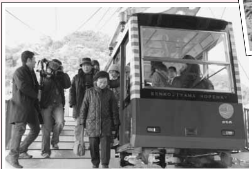
千光寺山ロープウェイ 公募によるデザインで客車がリニューアルされました。