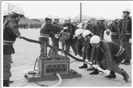
尾道市消防出初式 昔使用されていた腕用ポンプで放水実演しました。