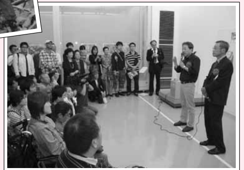
かわぐちかいじ展 尾道出身のマンガ作家かわぐちかいじさんの 展覧会が開催されました。