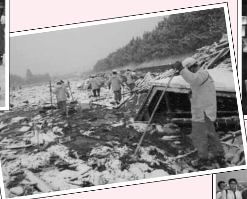
東日本大震災の被災地へ 宮城県などで支援活動を行いました。