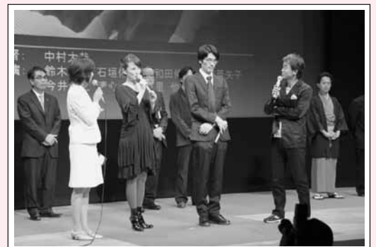
お蔵出し映画祭2011 劇場公開していない映画作品を上映。 グランプリ作品は来年劇場公開予定です。