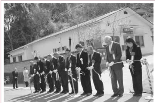
百島診療所開所 百島町で唯一の診療所が開所しました。