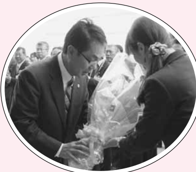
尾道市議会議員・尾道市長選挙 4月27日に平谷市長が初登庁しました。