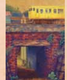
「嚮」 富田友一(愛知県) 日本画