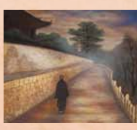
「夕暮れ」 藤井達雄(福山市) 日本画