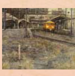
「尾道駅2番線」 濱本和信(尾道市) アクリル画