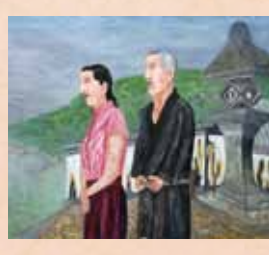
「尾道暮情」 伊藤英二(神奈川県) 油彩画