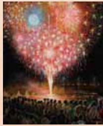
「水道華華」 大原信禮(三原市) 油彩画