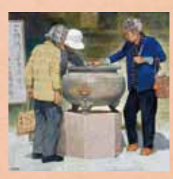
「お寺巡り」 森下修三(岡山県) 油彩画