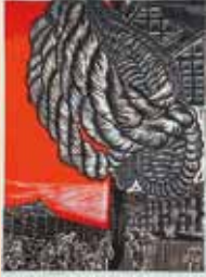
「小さな願い」 安藤秀信(香川県) その他(木版)