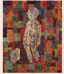
「作家 林美美子先生の像」 百崎三郎(愛知県) 油彩画