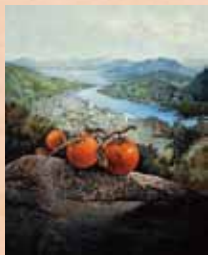
「旅して(よかった)」 生田公久(大阪府) 油彩画