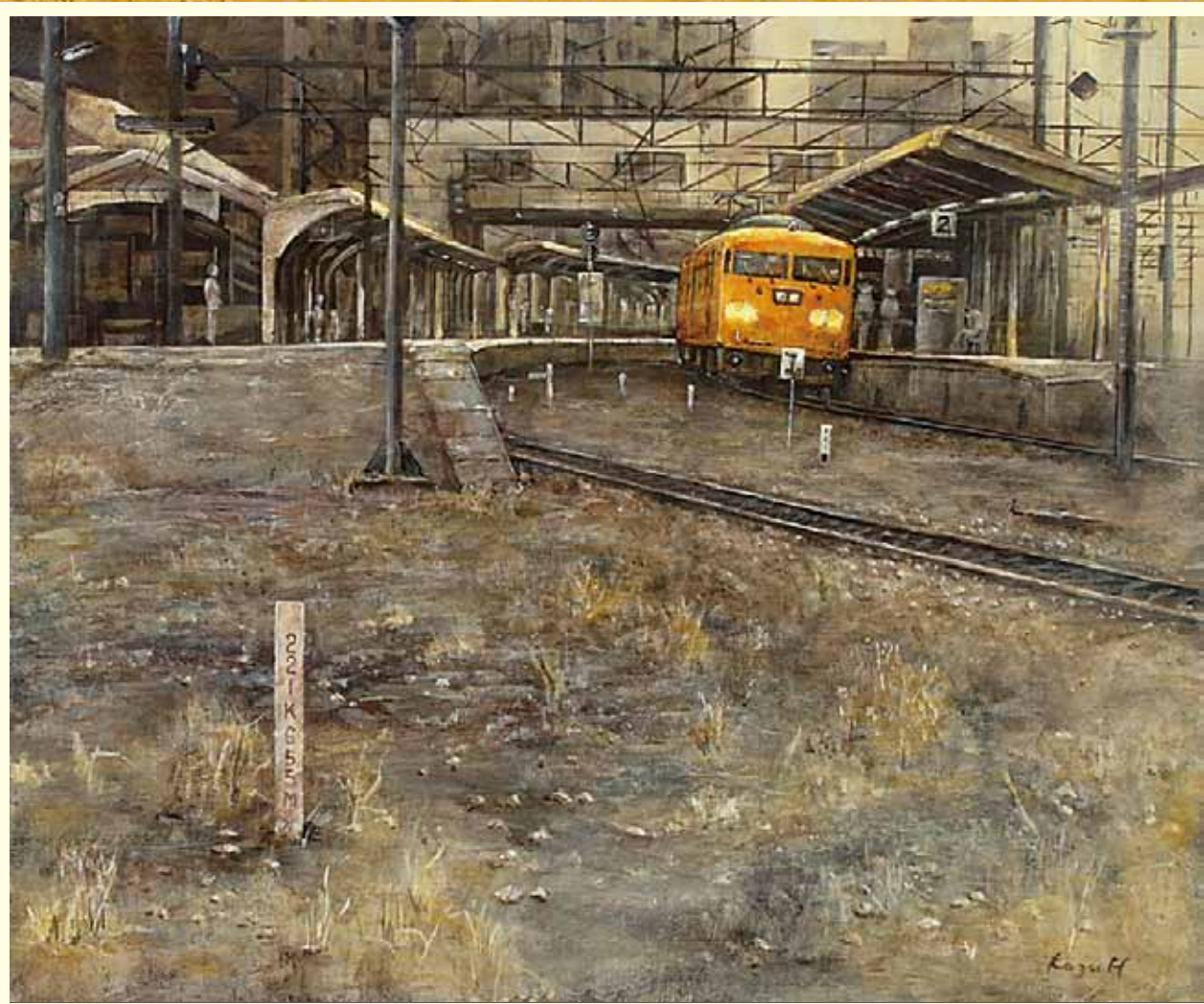
第16回絵のまち尾道四季展 尾道美術協会奨励賞