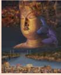
「浄土寺観音菩薩幻想」 出口由孝(和歌山県) アクリル画