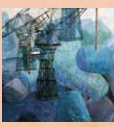
「蒼い風」 南浦節子(奈良県) アクリル画