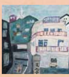
「帰り道」 志波和也(福岡県) アクリル画