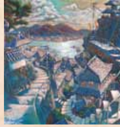
「夏~視点S」 大串誠寿(福岡県) 混合技法