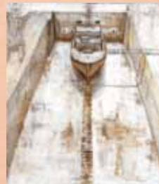
「刻々と変わる色」 楳本昌生(大阪府) アクリル画