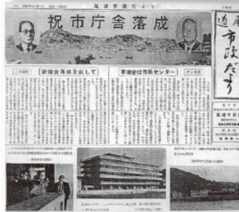
昭和35年4月5日発行「第95号」