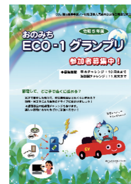
おのみちECO-1グランプリ