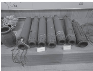
ウナギかご、アナゴかご

本展では、漁具資料館に眠っていた資料を一部お借りして展示しています。実際に使用されていた漁具を間近に、漁業水産都市を誇った尾道の歴史に触れていただければと思います。