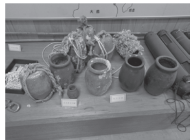
たこつぼ、イダコつぼ