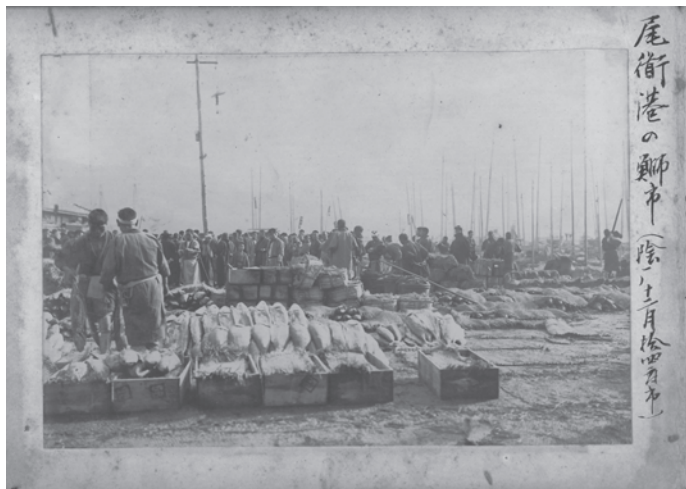
尾道港の鮓市（陰暦十二月十四日市） 明治時代・尾道市教育委員会蔵

毎年4、5月の時期は魚島（鯛が盛んにとれる時期）と呼ばれ、岡山、神戸、大阪、京都等各地に輸送する鯛の量は鉄道貨車二百数十車、この量目25万貫余り、価格は15万円以上に及び、鯛以外の魚も同様の漁獲量を誇りました。その光景は美観、壮観を極めたと言います。