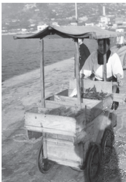
晩寄り 昭和30年代

同書によると、尾道から60人余りが漕ぎ手として従軍し、17人が戦死、16人の未亡人が残されたと記されています。