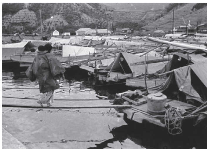
吉和漁港の家船 1957（昭和32）年

しかし、本年の調査によって、吉和における最後の家船が確認されました。取り壊し間際のことでしたが、船主の方に聞き取り調査が行われ家船の図面も書き起こされました。