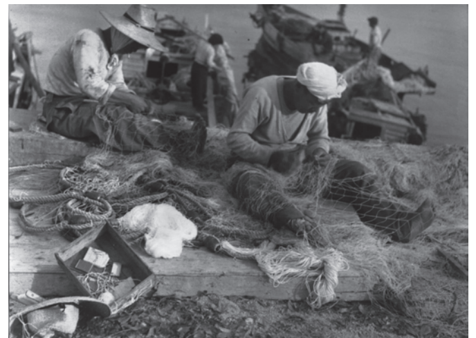
吉和漁港にて 1954（昭和29年）5月中旬

観光客や市民に対しては、市内の飲食店のうち、地魚を取り扱い、その魅力を積極的にPRする店を「尾道季節の地魚店」として認定し、あこう（キジハタ）を食材にした特別メニューを提供する「尾道あこう祭り」の開催、年間を通して尾道の地魚を提供していく「ワタリガニ祭り」等が行われています。