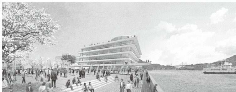
設計者「株式会社日建設計」から提案された新庁舎イメージ(無断転載を禁止します)

尾道市新庁舎平面計画案のパブリックコメントに80人・285件のご意見をいただきました。いただいたご意見と市の考え方を市ホームページに掲載しています。新庁舎を楽しみ、便利な場所にするためのアイデアは、引き続き募集しています。