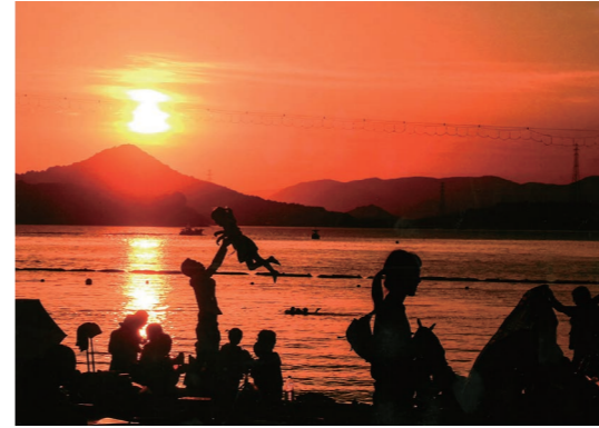
茜色に染まるサンセットビーチ 大亀福江(尾道市)