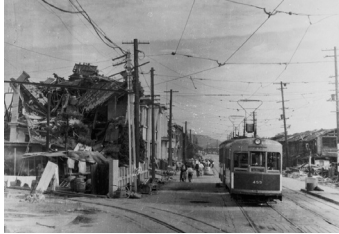
(広島電鉄本社と被爆電車1945年冬頃)