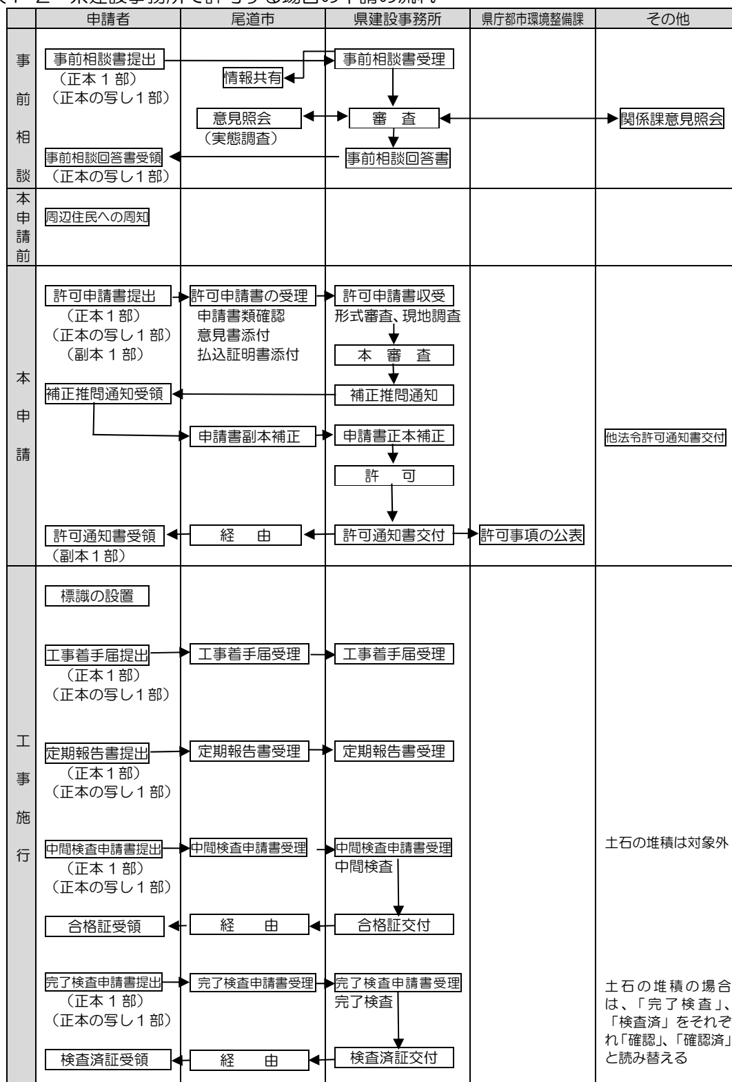
表7-2 県建設事務所で許可する場合の申請の流れ