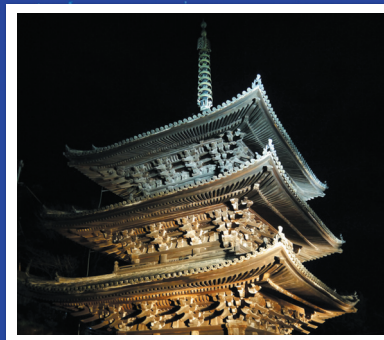
写真:照明デザイン:株式会社 石井幹子デザイン事務所