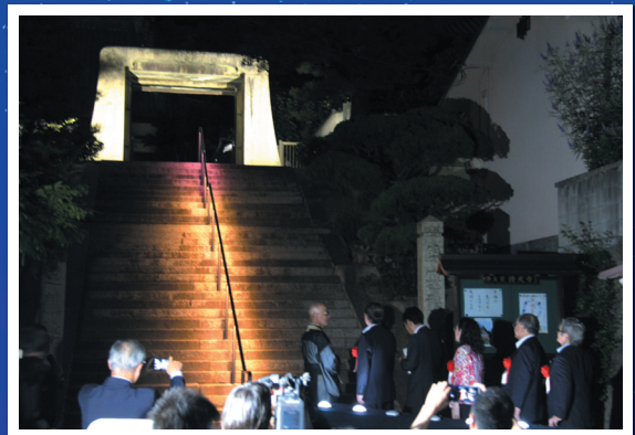
▲7月20日の点灯式の様子