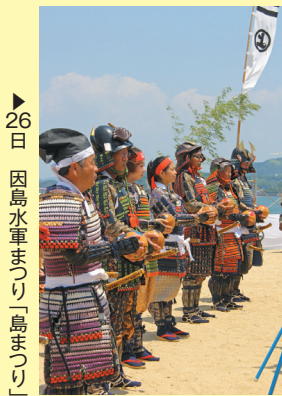
▶26日 因島水軍まつり「島まつり」