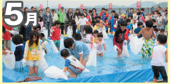
▲3日 因島アメニティ公園まつり(・4日)