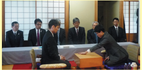
▲9日 第71期本因坊戦(・10日)