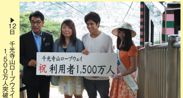
▶12日 千光寺山ロープウェイ 1,500万人突破