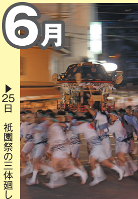
▶25日 祇園祭の三体廻し