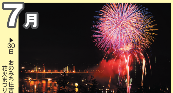
▶30日 おのみち住吉 花火まつり