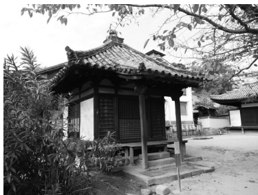
観音堂(重要文化財)