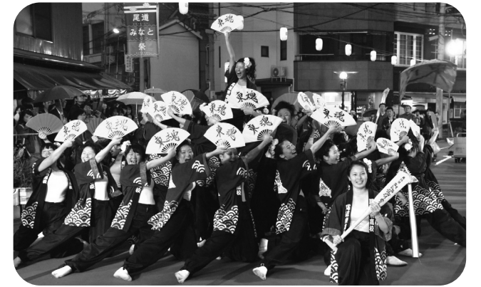
▲昨年の「第15回ええじゃんSANSA・がり」グランプリ部門優勝の尾道東高等学校