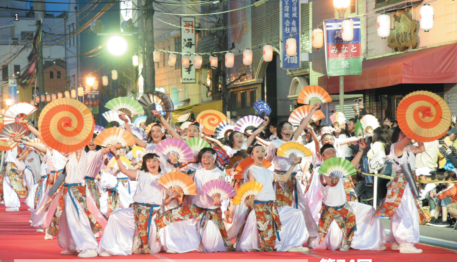
4月22日(土)・23日(日)に行われた第74回尾道みなと祭。恒例の「ええじゃんSANSA・がり踊りコンテスト」では、正調三下がりの曲をアレンジした軽快なリズムに合わせ、今年は2日間で102チーム約5,800人が個性あふれる踊りを披露しました。