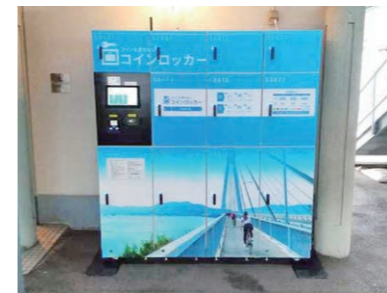
尾道駅前港湾駐車場に設置されているスマートロッカー