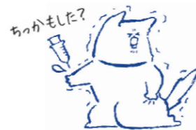
「ちっか」とは、尾道の方で「注射」のことです。(おのみちしぐさ「ペット マナー編」から)