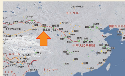
敦煌莫高窟は中国北西部に位置し、1987年には世界文化遺産に登録されました。

平山画伯がかつて学長を務めた東京藝術大学が、最新のデジタル3D技術と伝統的な日本画の技術を融合し、7世紀の石窟を現代に蘇らせた。