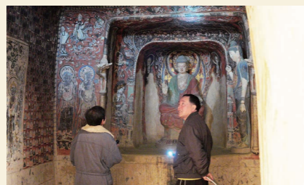
現地では非公開の壁画を間近で見れるとあって、大勢の人が訪れています。