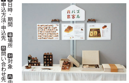
昨年度 グランプリ作品

尾道市立大学美術学科デザインコース3年生による、地域プレゼンテーション課題の展示を行います。 日 10月5日(月)～9日(金) 10:00～18:00/火曜休館 ※初日は14:00から。最終日は15:00まで。 場 しまなみ交流館 ■ギャラリートーク 日 10月7日(水) 14:00～ 問 尾道市立大学美術学科 (☎0848-22-8311代)