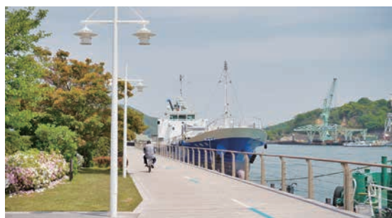
4・5月 日本全国が緊急事態宣言の対象となり、大型連休にも関わらず人通りもまばらに。