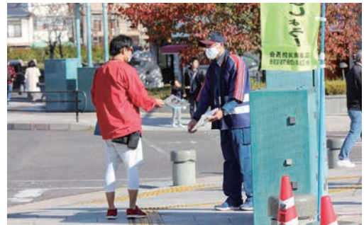
11月に尾道駅前で行った住宅防災対策の啓発活動を行いました。

コンセントとプラグの隙間に埃が溜まり、漏電により発火することがあります。差しっぱなしのコンセントはチェックしてみましょう。