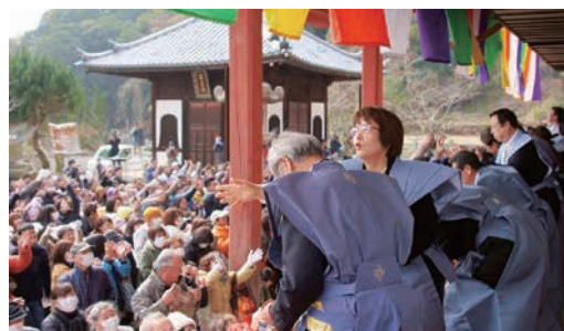
2月 西國寺で節分会の豆まき。「福」を求める多くの人でにぎわいました。