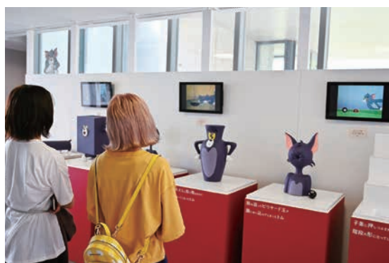
9月 尾道市立美術館で開催された「トムとジェリー展」の入館者が3万人を突破！