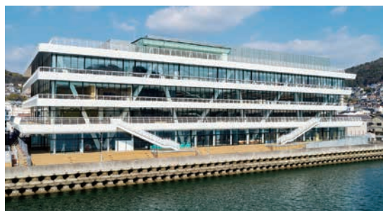
1月 市役所新本庁舎オープン。みんなの憩いの場、防災拠点として装いを新たに。

今年も残すところあとわずか。今年には世界中に広がる新型コロナウイルスの感染拡大により、一時は学校の休校や不要不急の外出を控えるなど、誰もが予想しなかった1年となりました。また、この危機を一刻も早く収束させ明るい生活を取り戻すため、「新しい生活様式」や「withコロナ」という言葉も生まれました。新しい年が明るいものになることを願って！写真で今年を振り返ります。