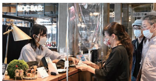
1人1万円の「チーム尾道がんばろう応援商品券」が登場！使用期間は1月31日までです。