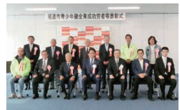
▲11月24日に行われた表彰式の様子