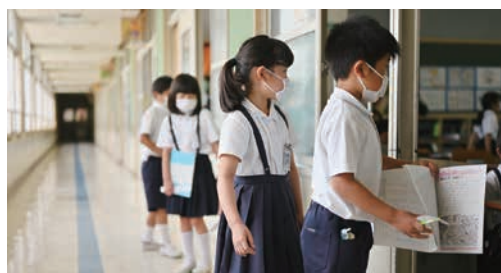
6月 休校していた小・中学校が再開。感染対策に配慮した「新しい生活様式」に合わせた学校生活が始まりました。