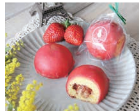
前回グランプリ 「尾道産 苺のマドレーヌ」 (10月のさくら)