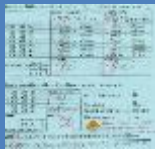
元気の達人カード

児童が自律的な生活習慣を身に付けられるように、体づくりと生活リズム（起きる、ねる時刻、テレビやゲーム・タブレット等の時間）の自己目標を設定し、実行後、成果を振り返る取組を継続しています。