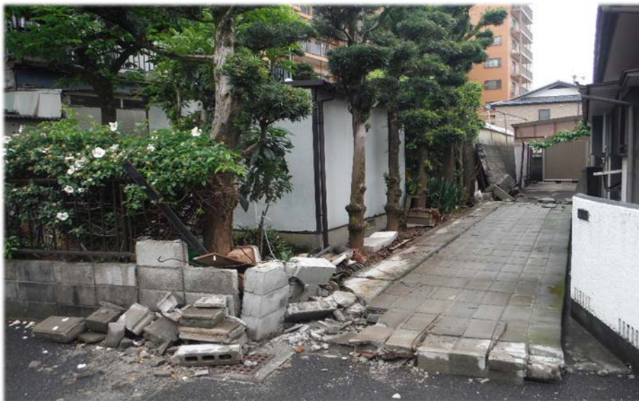
熊本地震で倒れたブロック塀

この事業は、道路等に面する倒壊の危険性のあるブロック塀等の除却・建替を行った場合、工事費の一部として、 最大で30万円 の補助を行う制度です。