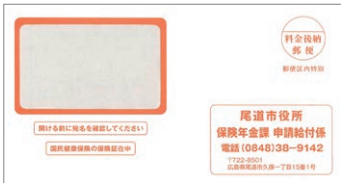
▲この封筒でお送りします

8月1日(月)から使用する保険証(水色)を、7月末日までに郵送します。8月からは新しい保険証を使用し、現在使用している保険証(紫色)はご自分で廃棄してください。