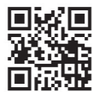
▲啓発動画 「『誰か』のことじゃない。」