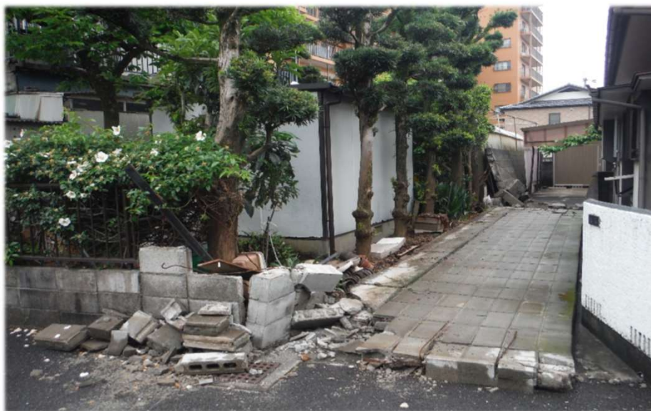
熊本地震で倒れたブロック塀

この事業は、道路等に面する倒壊の危険性のあるブロック塀等の除却・建替を行った場合、工事費の一部として、 最大で30万円 の補助を行う制度です。