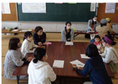
▲アイスブレイクで緊張をほぐします。