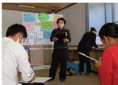
▲グループワーク中の様子です。

子どもと一緒に参加もできます。子育て中ならではの悩みを共有します。初めて子育てをする人は戸惑うことも多いですが、先輩から体験談を聞くとほっと一安心できます。また、いろいろな人と知り合えるのもこの講座の良さです。