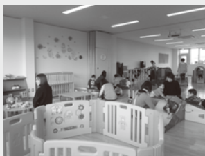
東尾道子育て支援センター(オープンスペース)

掲載以外でも子育て講座、出前講座を行っています。 育児・栄養に関する相談や、子育て情報の提供もできます。