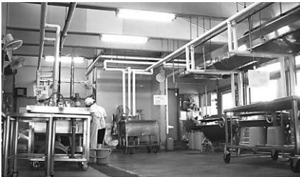
向東学校給食共同調理場