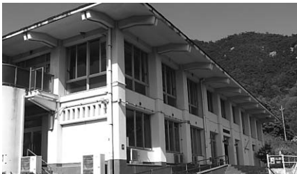
向島町立花自然活用村