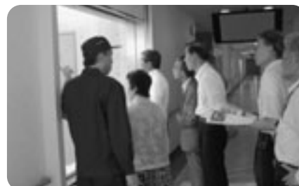
民生委員会視察風景