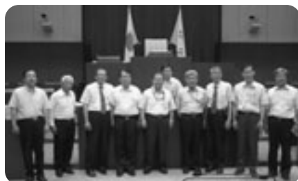
議会運営委員会視察風景