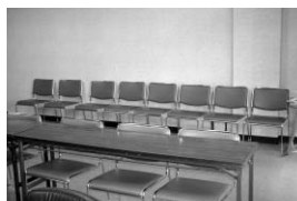
委員会室の傍聴席