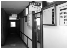
①市役所5階の議会事務局で受付

傍聴を希望する人は、当日、市役所5階の議会事務局までお越しください。受付で住所、名前、年齢を記入していただきます。