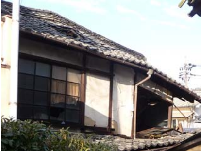
老朽危険建物除却促進事業

平成24年度から実施している補助事業について紹介します。(写真は平成25年度に「老朽危険建物除却促進事業」補助金を活用した例です。)