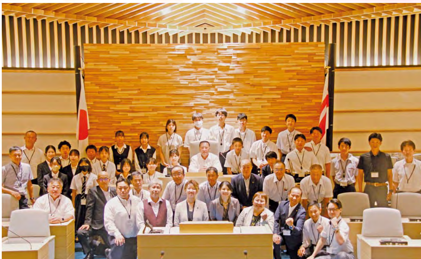
令和7年8月8日 第4回学生議会