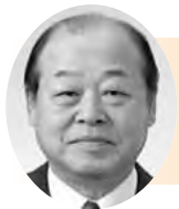
潮風おのみち いしもり けいし 石森 啓司