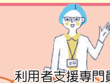
利用者支援専門員