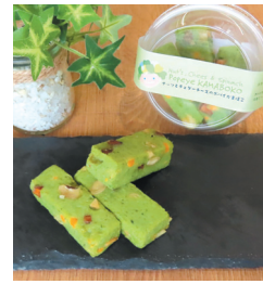
▲グランプリ 「ナッツとチェダーチーズの ポパイかまぼこ」

今回のテーマは「私やあなたの健康をつくる“ほうれん草”のおやつ」です。趣向をこらした力作ぞろい。応募作品は、各店舗等で販売しています。