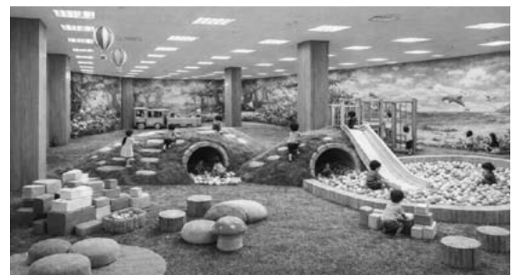
屋内子ども広場完成イメージ図

教育長 現在、登録団体は80以上あり、地域クラブや幅広い世代と交流しながら活動を楽しむことを目的とした公民館の自主講座・サークルなど様々である。指導者のスキルや資格も一律に基準は設けていないが、安心して生徒が参加できるように、安全確保や体罰・ハラスメントの防止などに係る指導方針等の遵守に誓約された団体を登録している。登録団体の指導者に対して、事故や暴力・暴言・ハラスメント、いじめ等の不適切行為の防止徹底などに向けた研修の実施を考えている。