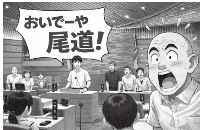
AI(チャットGPT)が約5分で作画した5枚のうちのイメージ画像

市長 昨年度65歳以上の高齢者の葬祭を本市が行った件数は11件。身寄りのない高齢者が亡くなられた場合の対応については権利擁護支援センターなどを研究する。市内の火葬場は各地区に6カ所あり、需要に応えられているが、いずれも建設から40年が経過、老朽化しており、計画的に施設更新を進めている。