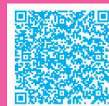
有料観覧席申込サイト

因島水軍まつりの臨場感を最前列で楽しめる 有料観覧席~好評販売中~ 1ブース:8,000円~(会場内駐車許可証付) 「尾道市電子申請システム」から申込ができます