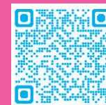
因島水軍まつり公式HP