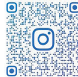
▲プロモーション動画(ひかりんさんInstagram)