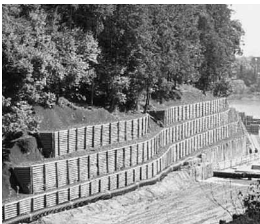
全天候フォレストベンチ工法

本市の土砂災害危険箇所は2210カ所でそのうち714カ所について、警戒区域として指定済み、指定率は約32・2%です。次に全天候フォレストベンチ工法についてですが、この工法は環境を保全しながら斜面の安定を図れる工法であると認識しております。今後、対策工事の実施にあたって、現場条件やコスト等を考慮して検討してまいります。