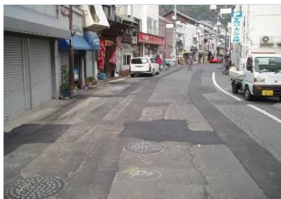
市道本通線（久保本町地区）