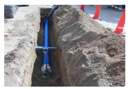
浄土寺建造物防災設備整備事業