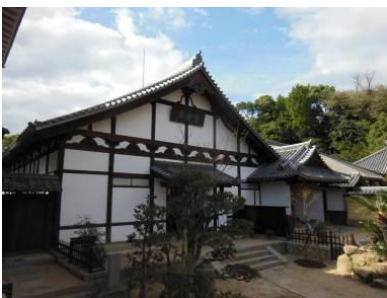
完成した庫裏及び客殿

重要文化財である浄土寺庫裏客殿等の保存修理が完了し、特別公開を行いました。引き続き、防災設備を整備しています。