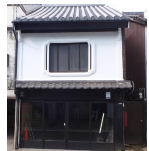
本瓦の葺き替え及び白漆喰仕上げの外壁により町屋を復元