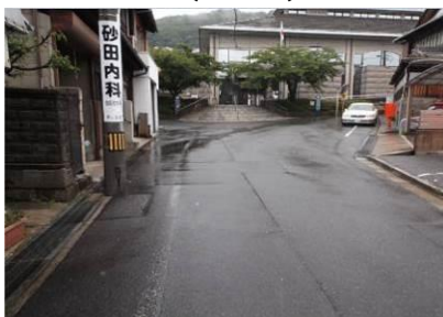
市道77号線（中央図書館周辺）