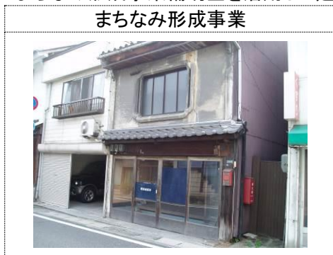
町屋の特徴である虫籠窓を持つ住宅