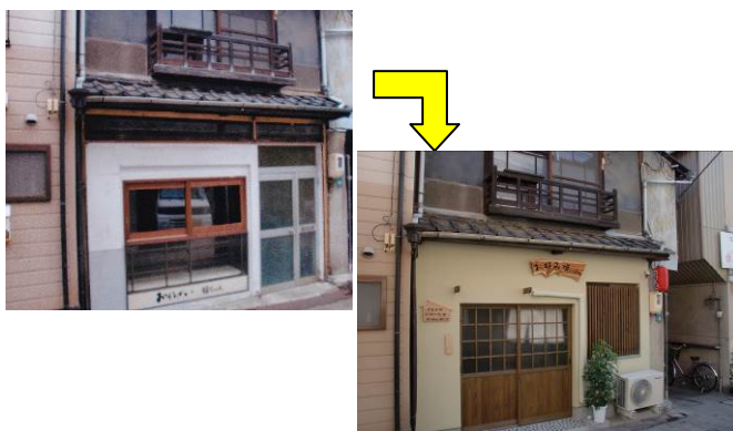
「空き家再生促進事業補助金」活用例