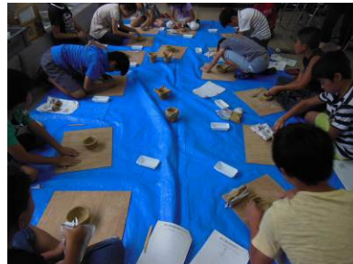
縄文土器づくり体験