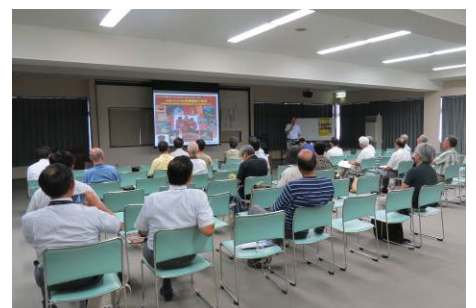
埋蔵文化財講演会の様子