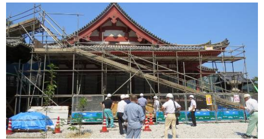
西國寺金堂建造物保存修理事業