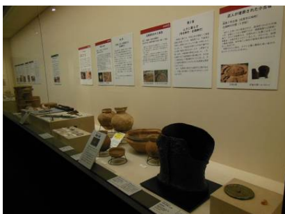
展示会「尾道松江線発掘物語」