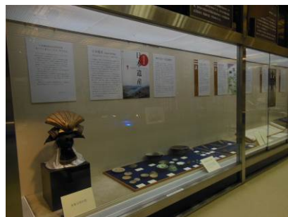
因島水軍城特別展